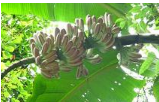
Fig. 5. Wild banana ( Musa itinerans ).

banking and conserving 10% of the world's wild plant species by banking its 24,200th species – a pink, wild banana from China ( Musa itinerans ) is a wild banana species and closely related to edible banana cultivars. Its pink to light purple fruits are an important staple food for the wild Asian elephants ( Elephas maximus ) and other wildlife in the tropical jungles. Its young flowers and pseudostem is a popular dish found at local restaurants in Southwest China and adjacent regions. It is an invaluable genetic resource for the tropical fruits industry and is a conservation priority for its food security value.