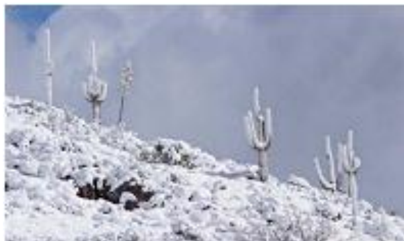
Fig. 3. Arisona (USA), 2018.

Historical climate change has had a profound effect on current biogeography, so we can expect our ongoing and rapid climate change, to have as great an effect. Climate change has important implications for nearly every aspect of life on Earth, and effects are already being felt.