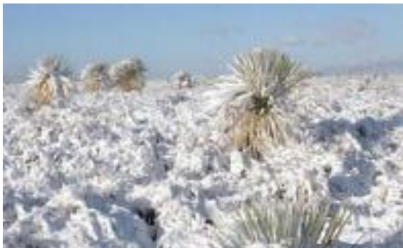
Fig. 2. Mexico (2018).