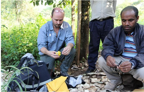
Fig. 6. A coffee farm in Ethiopia.

According to the Intergovernmental Panel on Climate Change (IPCC), the temperature on the planet has already increased by almost 1 ° C since the start of the industrial revolution. If humanity keeps current greenhouse gas emissions, then global warming can reach + 4C or more over the next 80 years [10].