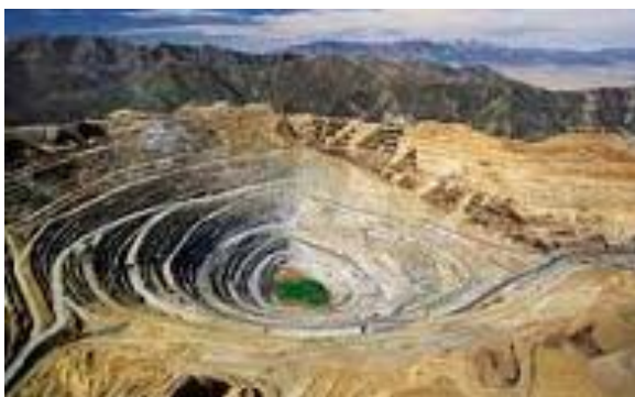
Fig. 4. Resource Depletion