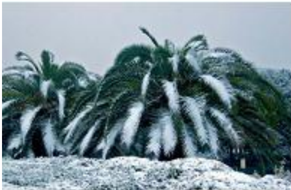
Fig. 1. Syria (2016).